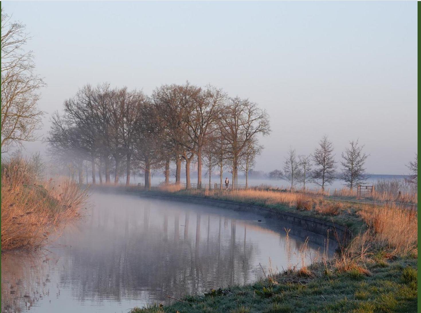
Foto: Orinda van den Bergh, Beemden. Op pagina 3 doet ze een oproep aan wijkgenoten die ook met fotografie bezig zijn.

Deze wijkkrant wordt je aangeboden door wijkvereniging Buurkracht Alandsbeek