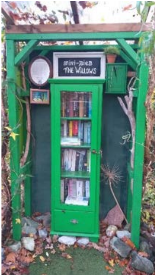
Minibieb 'The Willows' Zilverreiger