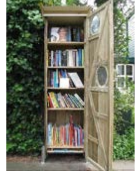
Minibieb aan de Waarden met de feestelijke onthulling door Truus en wethouder Overweg in 2017