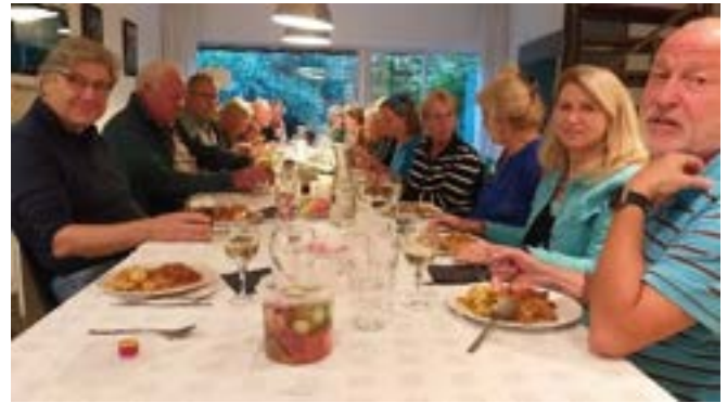
Ontmoetingsdiner september straatcontactpersonen

Voor veel straatcontactpersonen is de straatapp een goede vorm om praktische zaken uit te wisselen en de cohesie in de straat te bevorderen. Het is ook fijn als nieuwe bewoners welkom worden geheten en eventueel lid kunnen worden. Natuurlijk wil niet iedereen die hier woont contact en dat moeten we ook respecteren. Veel bewoners zijn echter blij als de Alandsbeker weer in de bus valt horen we. Onlangs hebben we afgesproken dat bewoners zich ook via een briefje (bij hun straatcontactpersoon) kunnen