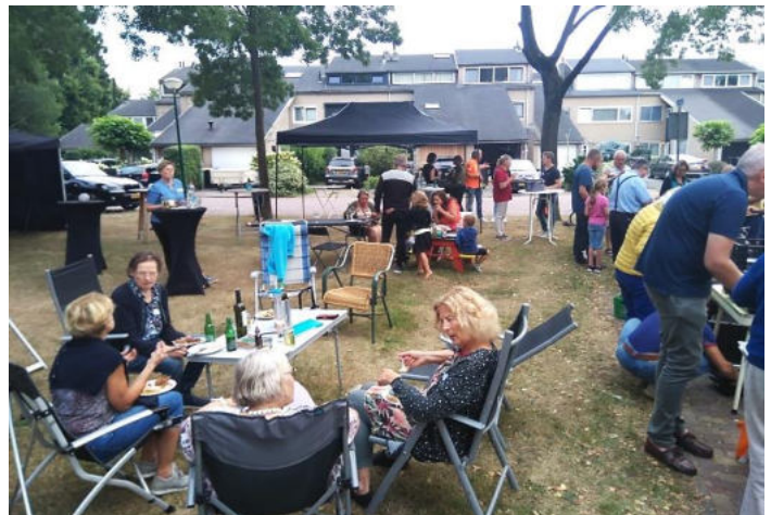
Straatfeest Karekiet-Grienden 26/8

Als wijkvereniging ontvangen we graag een leuke foto met toelichting van jullie burendag. Van de inzendingen doen we nadien verslag op de website: www.buurkrachtalandsbeek.nl