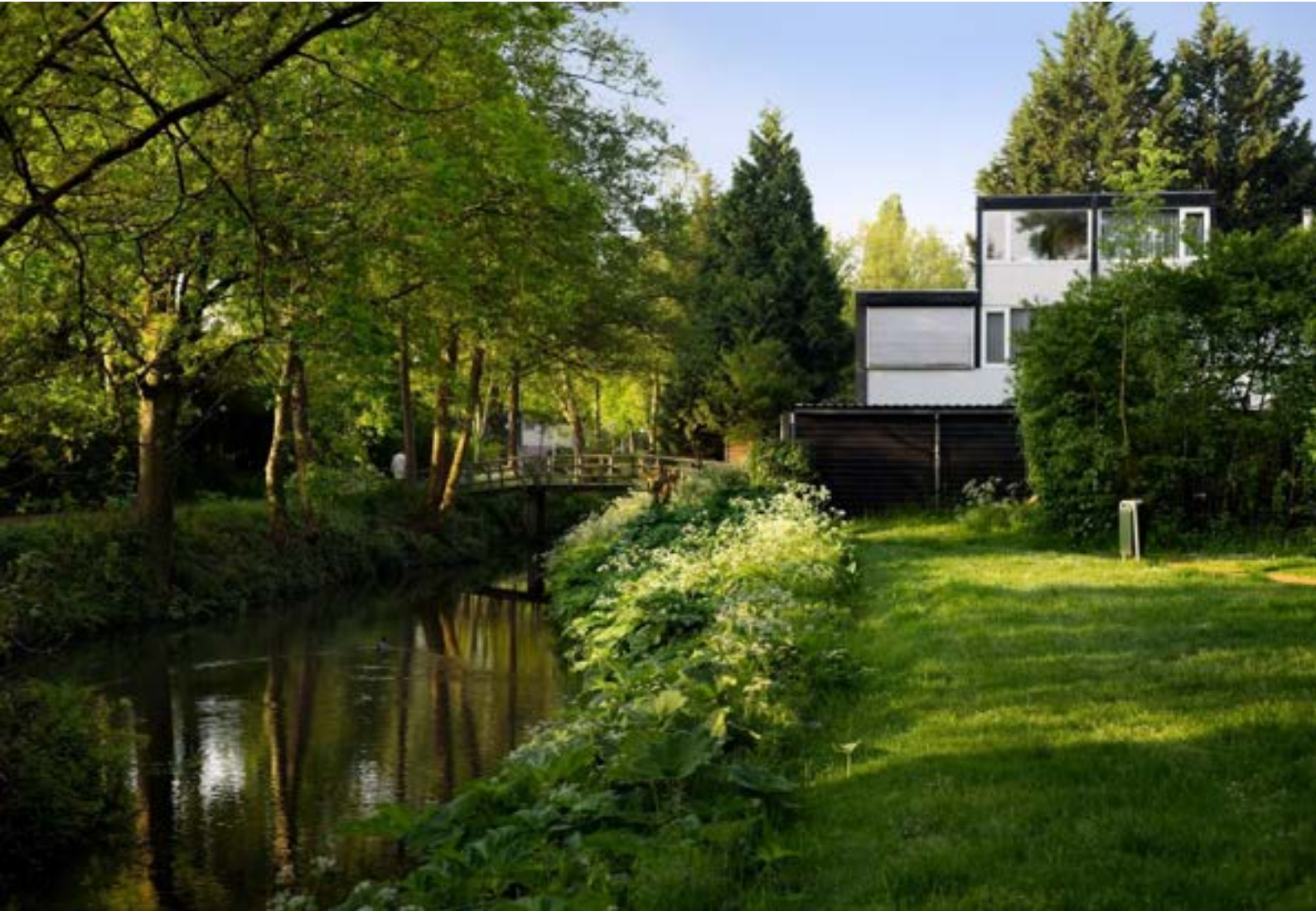
Foto: Jaap Kloppenburg, Parelduiker. Eén van de deelnemers aan de fotoexpositie (pag. 4).

Deze wijkkraant wordt je aangeboden door wijkvereniging Buurkracht Alandsbeek